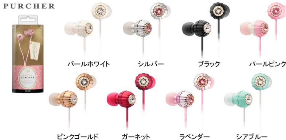
カナル型ヘッドホン「PURCHER(プシエル)」MXH-CJ151(全8色)

日立マクセル株式会社(取締役社長:千歳 喜弘、以下マクセル)はSWAROVSKI ELEMENTSを使用した女性向けのカナル型ヘッドホン「PURCHER(プシエル)」(MXH-CJ151)を8月25日より発売します。