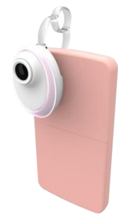
スマートフォンへの 装着イメージ