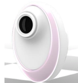
「Memoret(ミモレ)」 筐体デザイン(イメージ)

マクセル独自の光学設計による「スクエアファイン・レンズ」を採用した新開発の「Memoret(ミモレ)」は肌のキメ・シミを撮影するスマートフォン装着式レンズです。「Memoret」に内蔵した複数のLED光源と光学処理技術により、業務用装置並みの肌画像が得られます。また、女性の日用品として携帯できるよう、アルカリボタン電池式のコンパクト設計にしたほか、しなやかで美しいデザインを採用しました。スマートフォンには専用のフックで簡単に着脱できます。