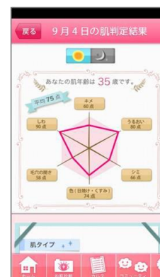
肌判定アプリ「Hada more」 画面イメージ