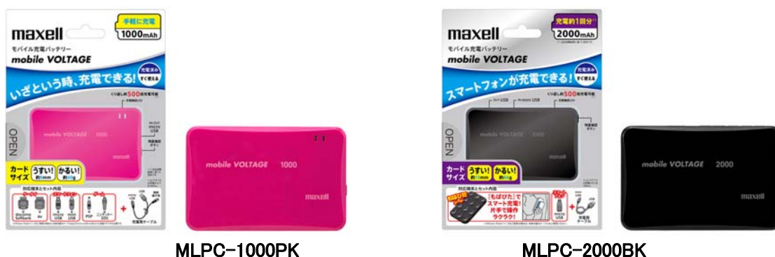
MLPC-1000PK MLPC-2000BK モバイル充電バッテリー「mobile VOLTAGE(モバイルボルテージ)」

日立マクセル株式会社(取締役社長:千歳 喜弘、以下マクセル)は、モバイル機器に外付けできる充電電池の「うすく」で「かるい」モバイル充電バッテリー「mobile VOLTAGE(モバイルボルテージ)」を11月28日より発売します。