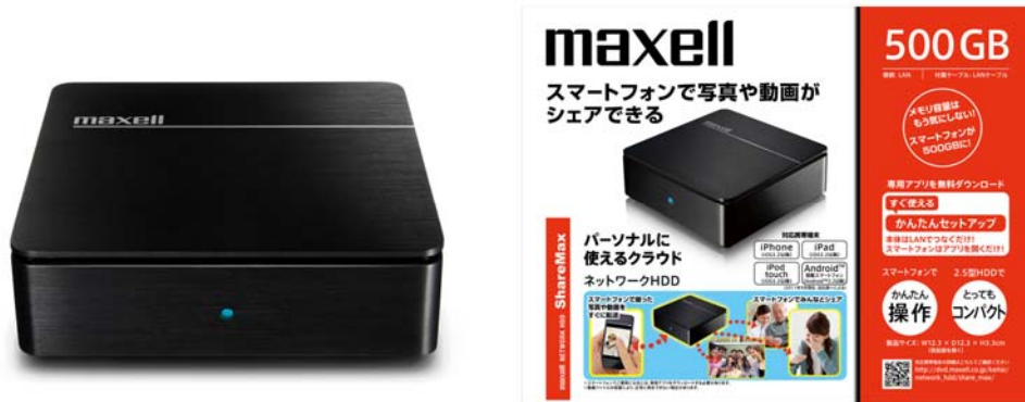
ネットワーク HDD 「Share Max」(M-2IHD500PS-JP.BK)

日立マクセル株式会社(取締役社長:千歳 喜弘、以下マクセル)は、スマートフォンなどのモバイル端末 *1 を使って、外出先から自宅のデータにいつでもどこでも *2 アクセスできるネットワーク HDD「ShareMax(シェアマックス)」(M-2IHD500PS-JP.BK)を11月25日より発売します。