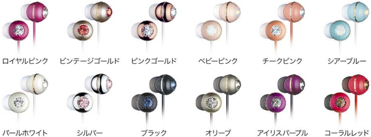
ジュエルスタイルヘッドホン「HP-CN15」(全12色)

日立マクセル株式会社(取締役社長:千歳 喜弘、以下マクセル)は、大粒のSWAROVSKI ELEMENTSを使用したジュエルスタイルシリーズのカナル型ヘッドホン「HP-CN15」を10月25日より発売します。