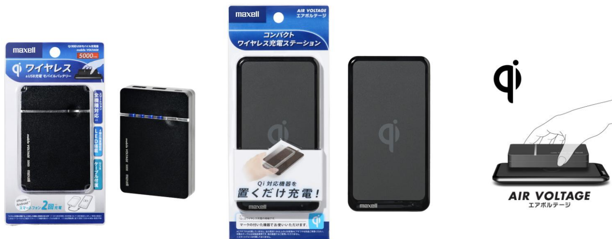
Qi 規格対応ワイヤレス&USB モバイル充電器 「mobile VOLTAGE」(WP-EMBL5000BK)