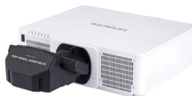
「9000シリーズ」装着時の外観

日立マクセル株式会社(取締役社長:千歳 喜弘/以下マクセル)は、高輝度 DLP®プロジェクター「9000シリーズ」用固定超短焦点レンズ「FL-900」を2015年7月より発売します。