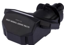
固定超短焦点レンズ「FL-900」の外観