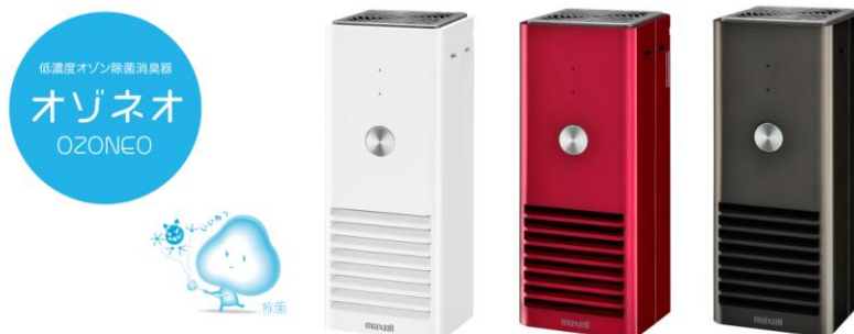
「オゾネオ」インテリアタイプ MXAP-AR200 (全3色)

日立マクセル株式会社(取締役社長:千歳 喜弘/以下マクセル)は、特許技術の「多重リング式コロナ放電」*1 によって適量の低濃度オゾン*3 とイオン風を効果的に発生させることで除菌・ウイルス除去・消臭を可能にした、低濃度オゾン除菌消臭器「オゾネオ(OZONEO)」を4月25日より発売します。