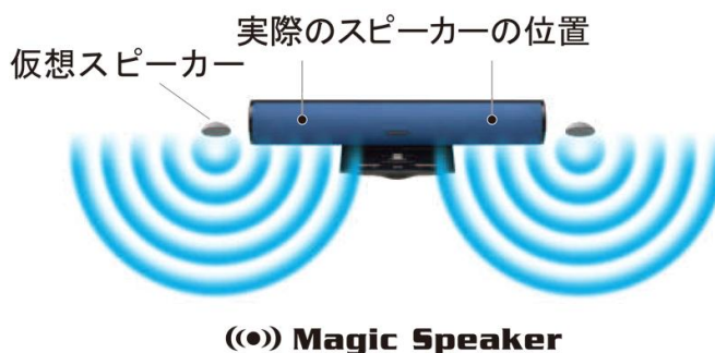
((●)) Magic Speaker

「Magic Speaker」とは、音に広がりをもたせて立体感を高め、外側左右の仮想スピーカーから音が迫ってくるかのように聴こえる3D音響技術です。コンパクトなボディサイズを超えるスケールで立体的な音場をつくりだすとともに、直径46mmのアルミコーンスピーカーにより臨場感あふれる繊細かつダイナミックなサウンドを再現します。