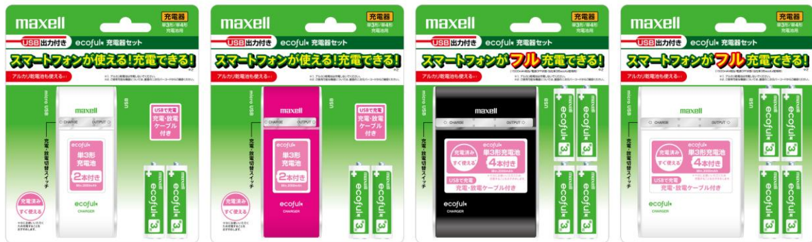
USB出力付きニッケル水素電池充電器「ecoful CHARGER」(MHRC-150/MHRC-300)

日立マクセル株式会社(取締役社長:千歳 喜弘、以下マクセル)は、USB出力付きでスマートフォンの充電もできる単3形/単4形兼用のニッケル水素電池充電器「ecoful CHARGER(エコフルチャージャー)」を7月14日より発売します。