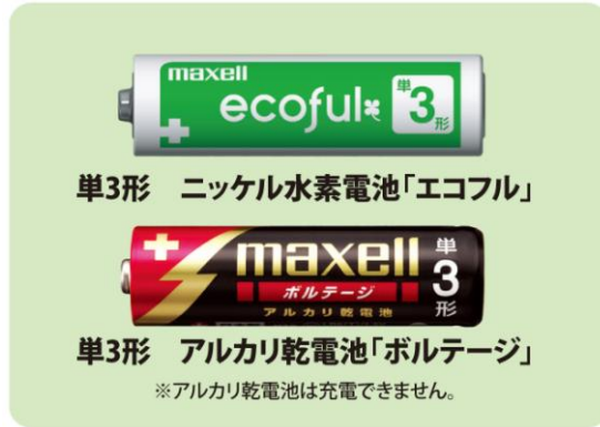
スマートフォンを充電するときの推奨電池