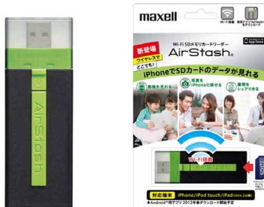
Wi-Fi SD メモリカードリーダー「AirStash」(MAS-A02)

日立マクセル株式会社(取締役社長:千歳 喜弘、以下マクセル)は、iPhone/iPod touch/iPad のワイヤレス通信によって SD カードの写真や動画を見ることができる Wi-Fi SD メモリカードリーダー「AirStash(エアスタッシュ)」を2012年2月25日より発売します。