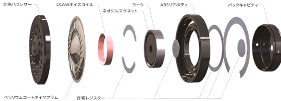
ドライバユニット分解図