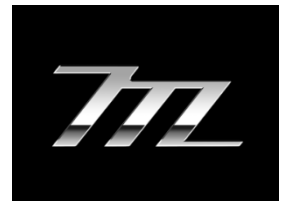
シンボルマーク「m(エム)」