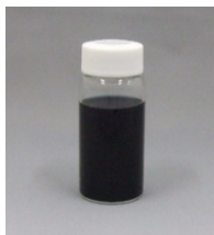
透明導電塗料(導電ポリマー系、金属酸化物)